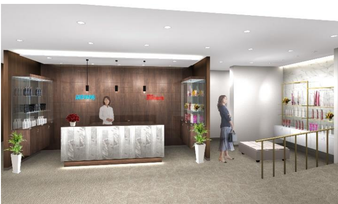
「アデランス千里中央」（イメージ図）

さらに、周囲を気にせずリラックスしてご利用いただける、全室個室の男性用ブースを2つ、女性用ブースを3つずつ各店舗にご用意しました。遠方のお客様には、訪問・出張サービスも行っており、専門のヘアスタイリストがお客様の魅力を最大限に引き出すオーダーメイド・ウィッグや増毛、育毛などのトータルケアをご提案します。他社でウィッグを購入したが、スタイルが合わない、カラーが合わない、メンテナンスができないなどのお悩みをお持ちの方にも、アフターメンテナンスを実施しております。