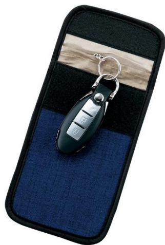
『セキュリティーキー&スマートケース』 （男性向け）