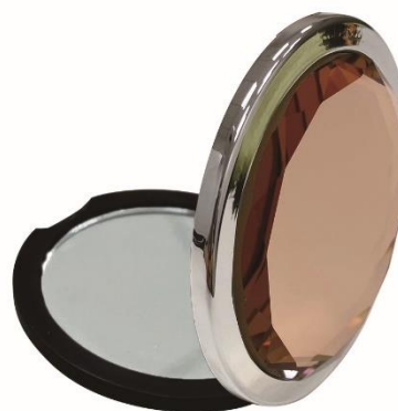
『コンパクトカラージュエルミラー』 （女性向け）