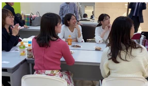
アイデア会議の様子

今回のコラボデザインは、「CURUCURU select」に会員登録している女性ゴルファーに協力いただきました。座談会では、「日焼けで頭皮が焦げたことがある」、「日焼けによる髪の毛の傷みはとても気になる」、「ゴルフを目一杯楽しみたいので、UVケアは重要。でもダサいパッケージは持ちたくない」、「全身に使えるのは良い」など様々な意見がでました。