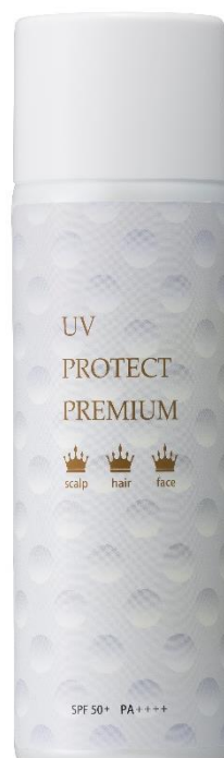
『ビューステージ UV プロテクト プレミアム sp』

そこで、紫外線リスクも高いゴルフをプレイする女性をターゲットに、女性ゴルファーの方でも手に取っていただきやすいパッケージを「CURUCURU select」とコラボしてデザインしました。今回は「CURUCURU select」に会員登録している女性ゴルファーを集めた座談会を数回開催し、使いたくなるパッケージについて、意見を集めました。集まったアイデアを基に開発したパッケージは、ゴルフボールのディンプル（くぼみ）をモチーフにしたデザインで、高級感のあるパッケージに仕上がりました。