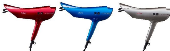
ヘアプロ N-LED Sonic