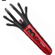
ヘアプロ スカルプ LED EX