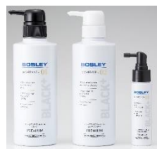
ボズレー ブラックプラスコントロール PREMIUM

キャンペーン実施期間中に1回のお会計で対象商品を税込7,920円以上ご購入された方に『ボズレー ブラックプラスコントロール PREMIUM』パウチ(シャンプー&コンディショナー)の3個セットをプレゼントいたします。