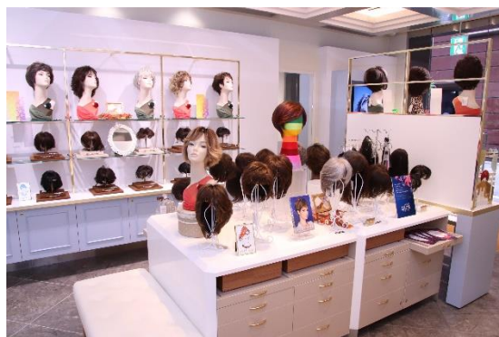
『フォンテーヌ銀座』