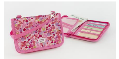
オリジナルお出かけポーチ