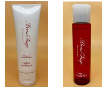
BeauStage VigiCo FACE WASH（左）、 BeauStage VigiCo FACE LOTION

■『フォンテーヌ銀座』リニューアル記念プレゼント（2020年9月16日～9月30日）