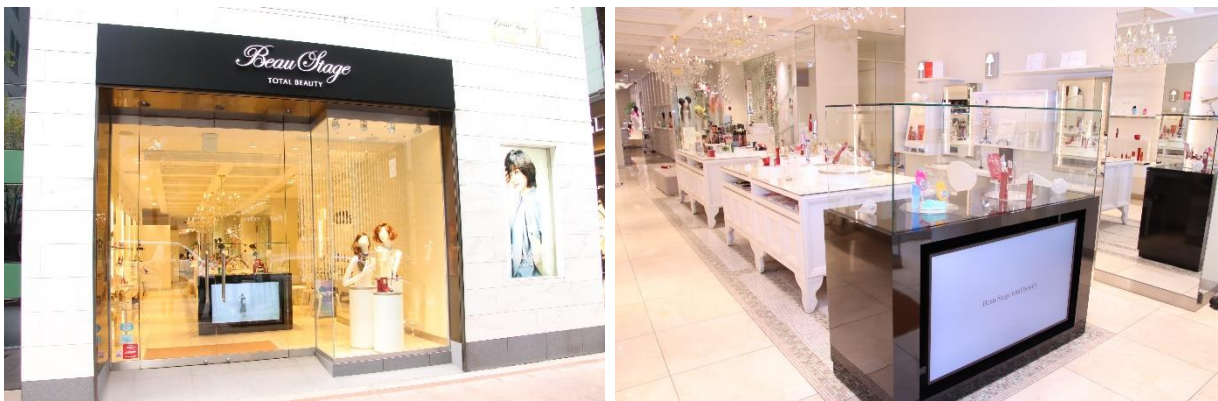
『ビューステージ銀座』