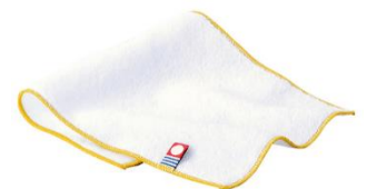
今治タオルハンカチ

期間中にご来店されたお客様に「今治タオルハンカチ」（先着 100 名様）をプレゼントします。