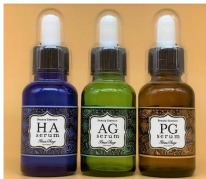
左から「HA セラム」「AG セラム」「PG セラム」