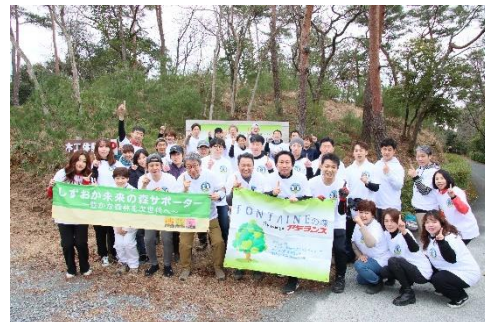
当社看板の前での記念撮影

今年度は、昨年を上回る 38 名の参加者数となり、うち初参加が 9 名となりました。参加者は植樹方法を教わり、木の根が張る森林の斜面を掘り返しながらアカマツの苗木を 100 本植樹しました。2009年の植樹開始から 14 年で累計植樹本数は 1,705 本、環境保全面積は累計で 26,889 m 2 （東京ドーム半分以上の面積）となり、活動の範囲も年々増しています。