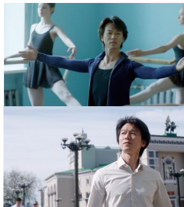
『ヘアパーフェクト レジェンド』新 TV-CM