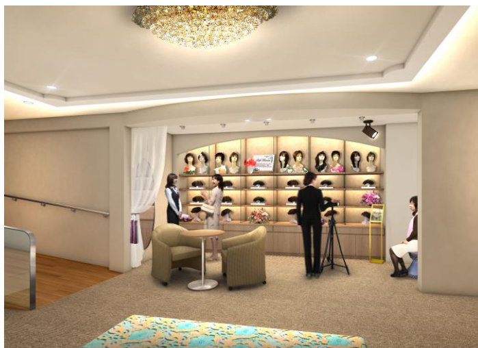
「アデランス渋谷」（イメージ図）

アデランスでは、近年ウィッグをファッションとして楽しむ女性が増加しているのを背景に、さまざまな髪型をお楽しみいただける「スタイル・ミュージアム」の導入店舗を拡大しております。今回移転リニューアルする「アデランス渋谷」は、渋谷の中心部に位置しながら、都会の喧騒とはかけ離れた上質な空間と心からのおもてなしでお客様をお迎えいたします。