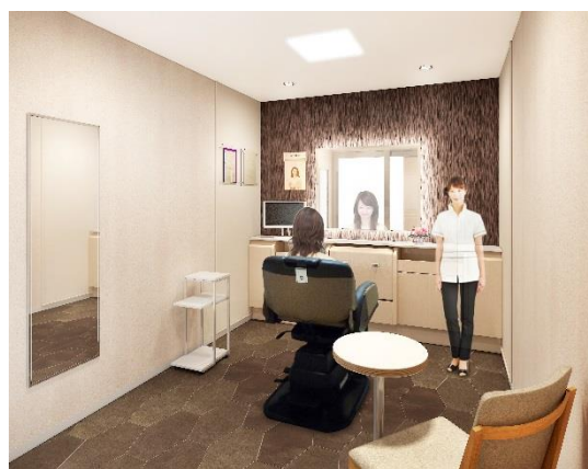
女性用ブース（イメージ図）