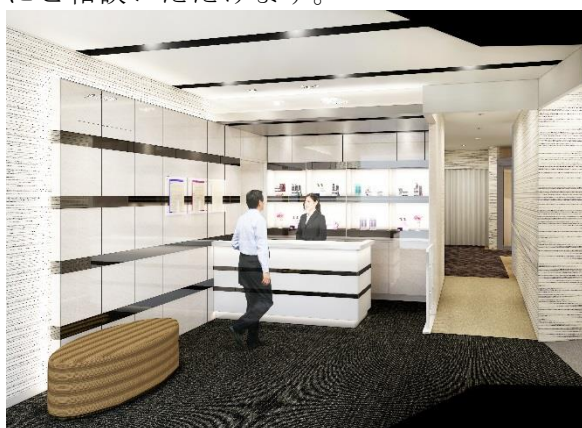
エントランス（イメージ図）

女性サロンには、近年ウィッグをファッションとして楽しむ女性が増加していることを背景に、フォトスペースを設けました。ロングヘアやショートヘアなど様々なスタイルのウィッグをご試着いただき、一眼レフカメラにて撮影した写真をお持ち帰りいただけます。また、カウンセリングルームには、ヘア & スカルプをチェックし、お客様にご覧いただきやすいよう大型モニターを設置しました。専門のヘアスタイリストがお客様の魅力を最大限に引き出すオーダーメイド・ウィッグや増毛、育毛などトータルヘアをお手伝いします。また、大学やパートナー企業との共同研究など、毛髪研究から生まれた、機能的なヘア & スカルプケア商品も豊富にラインナップしております。さらに、他社でウィッグを購入したが、スタイルが合わない、カラーが合わない、メンテナンスができないなど、お悩みの方にもアフターメンテナンスを実施しておりますので、お気軽にご相談いただけます。