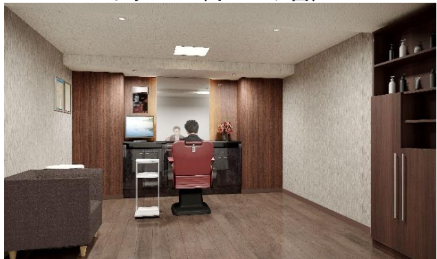
男性用納品ブース（イメージ図）