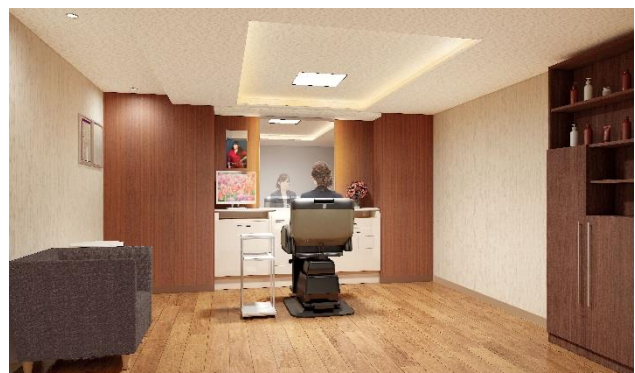
女性用納品ブース（イメージ図）