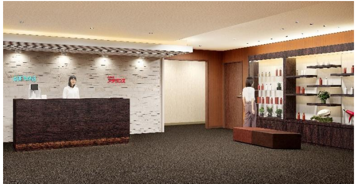
ディスプレイスペースが隣接する エントランス（イメージ図）

カウンセリングルームには、頭皮の状態をチェックし、お客様にご覧いただきやすいよう大型モニターを設置しました。専門のヘアスタイリストがお客様の魅力を最大限に引き出すオーダーメイド・ウィッグや増毛、育毛などトータルケアをお手伝いします。また、大学やパートナー企業との共同研究など、毛髪研究から生まれた、機能的なヘア&スカルプケア商品も豊富にラインナップしております。さらに、他社でウィッグを購入したが、スタイルが合わない、カラーが合わない、メンテナンスができないなど、お悩みの方にもアフターメンテナンスを実施しておりますので、お気軽にご相談いただけます。