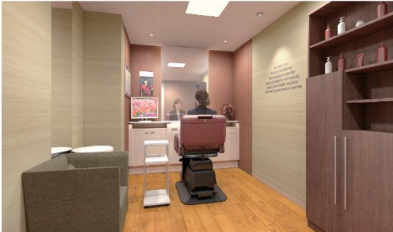
女性用ブース（イメージ図）