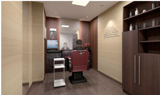
男性用ブース（イメージ図）

さらに、他社でウィッグを購入したが、スタイルが合わない、カラーが合わない、メンテナンスができないなど、お悩みの方にもアフターメンテナンスを実施しておりますので、お気軽にご相談いただけます。