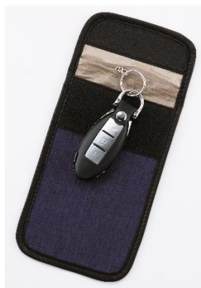
セキュリティキー&スマートケース （男性向け）