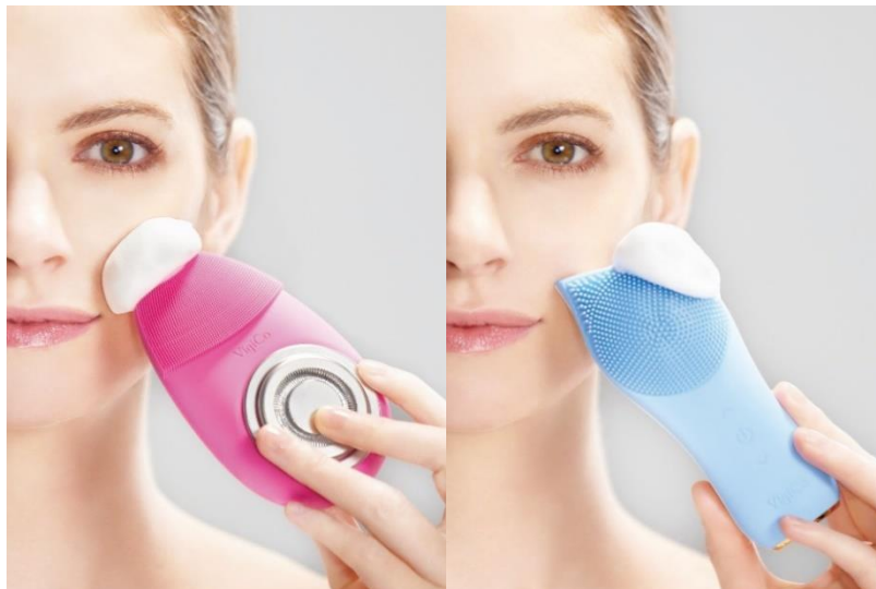
『Beau Stage VigiCo beauty』（画像左）、『Beau Stage VigiCo relax』（画像右）

『Beau Stage VigiCo』シリーズは、音波振動により汚れを浮き上がらせることで、手洗いでは落としにくいメイク汚れや皮脂、古い角質などを、効果的に取り除くことができるフェイシャル美容機器です。本シリーズは、音波振動機能に加え、それぞれ特徴の異なる2商品をご用意しています。『Beau Stage VigiCo beauty』には「イオン導出入」機能を搭載しており、イオン導入では化粧水などの有効成分を肌の角質層まで浸透させます。一方イオン導出では、毛穴に詰まった汚れを吸着させます。『Beau Stage VigiCo relax』には、温熱機能を搭載しており、シリコンブラシが温まり、よりリラックスした状態でクレンジングすることができます。