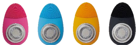
Beau Stage VigiCo beauty

女性が使いやすいかわいらしいデザインで、2 商品それぞれ 4 色のカラーバリエーションをご用意しました。毎日のフェイスクアの負担にならないよう、コンパクトで軽い仕様に設計しています。