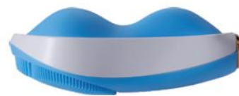
裏面はカッサ仕様に

『Beau Stage VigiCo relax』には、シリコンブラシが温まる「温熱機能」を備えており、心地よくクレンジングができます。また、本体裏面はカッサ仕様になっており、くぼみ部分をフェイスラインにあてて優しく動かすことで、フェイスクアが可能です。