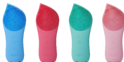
Beau Stage VigiCo relax