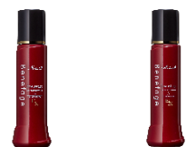
「ベネファージュ薬用スカルプグロウEX α」（左） 「ベネファージュ薬用スカルプグロウEX β」（右）