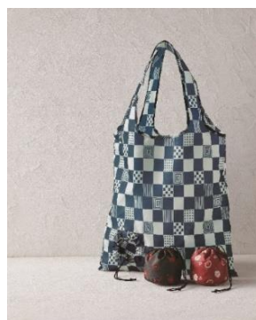
くろちく お手玉えこばっぐ（市松模様）