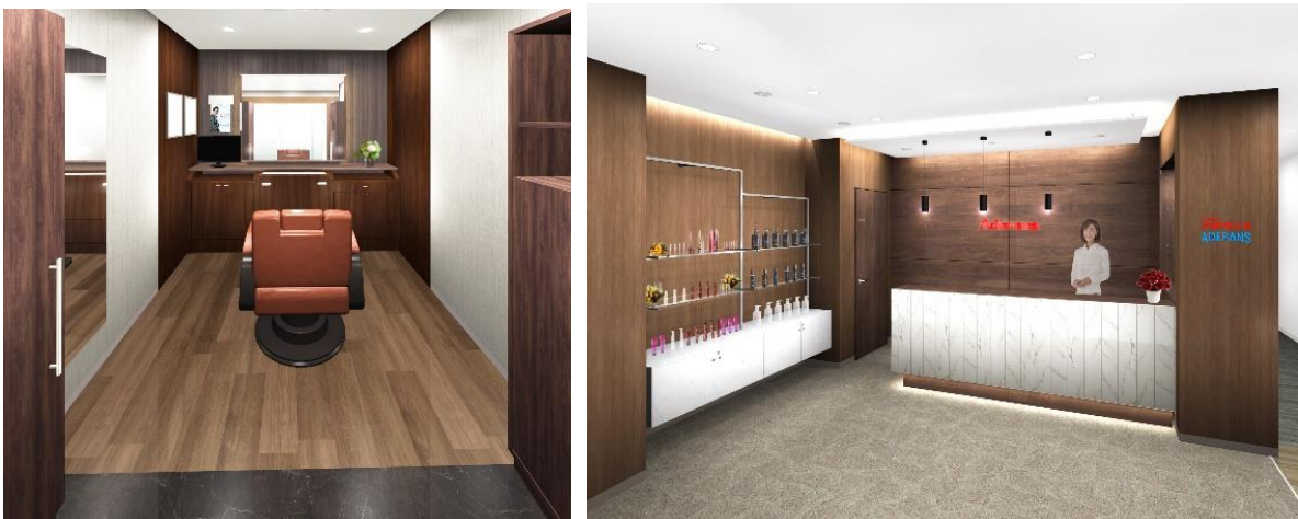
左：男性ブース、右：エントランス（イメージ図）

また、パートナー企業との共同研究など、毛髪研究から生まれた、ヘア&スカルプケア商品も豊富にラインナップしています。更に、他社でウィッグを購入したが、スタイルが合わない、カラーが合わない、メンテナンスができないなど、お悩みの方にもアフターメンテナンスを実施しておりますので、お気軽にご相談いただけます。