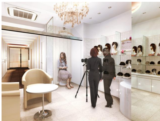
「アデランス天王寺あべのハルカス」（イメージ図）

アデランスでは、近年ウィッグをファッションとして楽しむ女性が増加しているのを背景に、さまざまな髪型をお楽しみいただける「スタイル・ミュージアム」の導入店舗を拡大しております。「アデランス天王寺あべのハルカス」の移転先は、2014 年 3 月に全面開業した、大阪の新たなランドマークとして注目を集める「あべのハルカス」の 28 階。明るい陽射しが差し込む心地よい店内からは阿倍野エリアが一望でき、極上の空間と上質のおもてなしにてお客様をお迎えいたします。