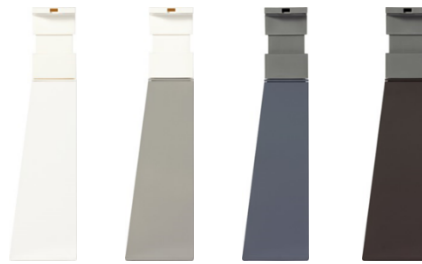
専用ディスペンサー