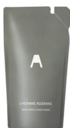
コンディショナー