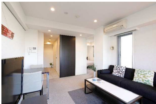
▲BUREAU 高輪 (1LDK Hタイプ)

これを機会に民泊を利用したサービスアパートメントに泊まるという「新しい宿泊スタイル」を是非、ご体験ください。