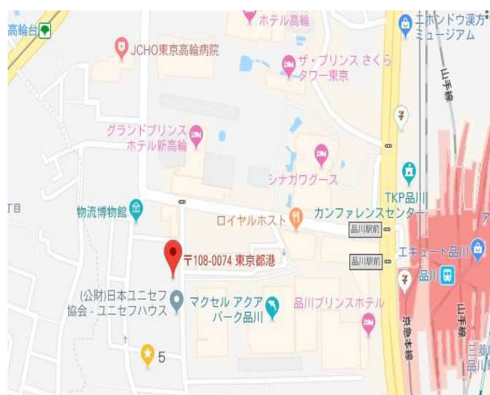
▲BUREAU 高輪 位置図