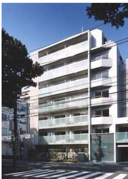
▲BUREAU 高輪 外観

ビュロー高輪 https://www.airbnb.jp/users/show/190927614