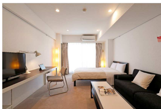
▲BUREAU 高輪(STUDIO Bタイプ)