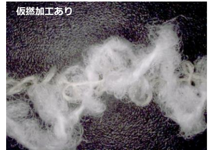
パパあらって なめらかタッチ (新商品)