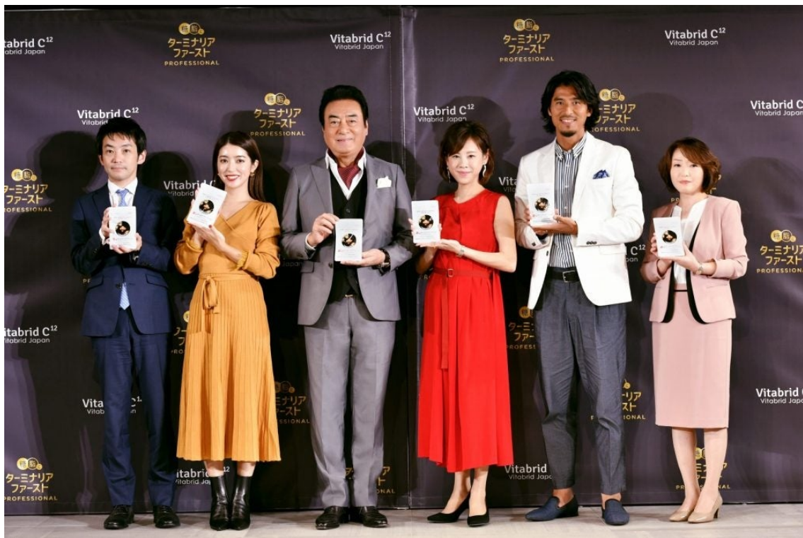
※写真は2019年10月製品発表会の様子

多くの方にお選びいただき、発売から約4年2ヶ月で累計販売数750万袋(※1)を突破。「美味しい」も「健康」も妥協しない芸能人やアスリートなどの著名人の方々にも活用され、雑誌などのメディアにも多数取り上げていただいております。