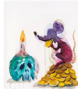
Manuel Ocampo "Untitled" (VETA by Fer Francés)