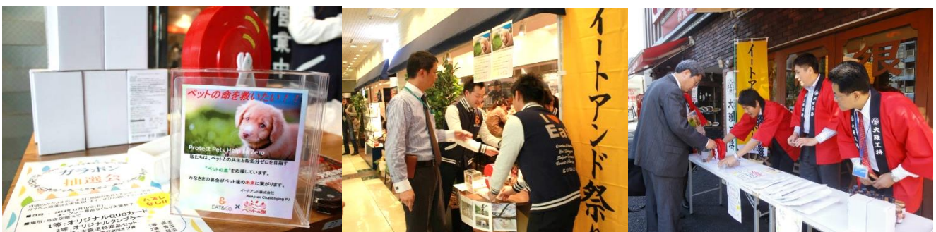
2014年11月に実施した「イトの日」募金活動の様子

10年の以上の長きに渡って行ってきたイトの日は、2020年10月1日、持株会社体制に移行し、ホールディングス化いたしましたためグループ全体を通しての活動は今期で最後となります。