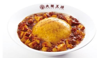
ふわとろ麻婆天津飯