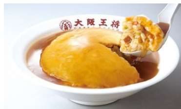
ふわとろ天津炒飯