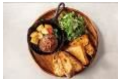
千葉県8種の野菜のベジカレー(880円+税) 熟成粗挽きハンバーグ(980円+税)