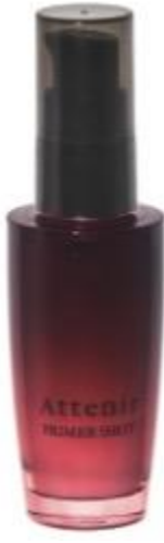
ダマスクローズを 基調とした 幸福感に包まれる香り