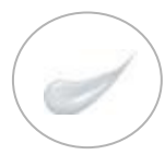
白濁した みずみずしい エッセンス

弱酸性、無着色、無鉱物油、パラベンフリー、アルコールフリー、アレルギーテスト済み(すべての方にアレルギーが起きないわけではありません)