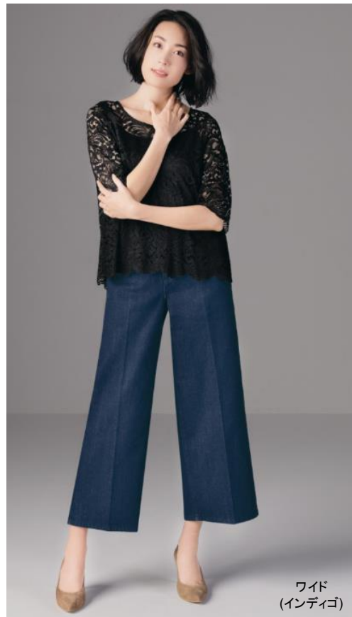
ワイド (インディゴ)