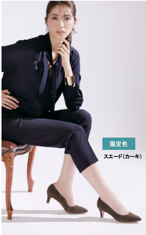
限定色 スエード(カーキ)

定番色である「スエード(ブラック)」、「スエード(グレージュ)」、「スムース・表革(ブラック)」に加え、秋冬のコーデを洗練させる「スエード(カーキ)」、「スエード(ヒョウ柄)」の2色が数量限定で登場しました。