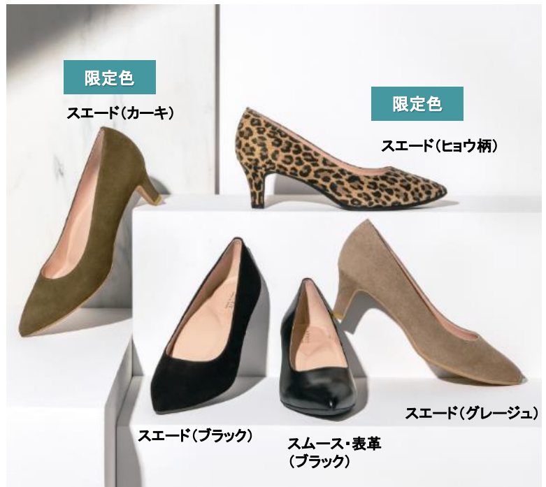
限定色 スエード(カーキ)