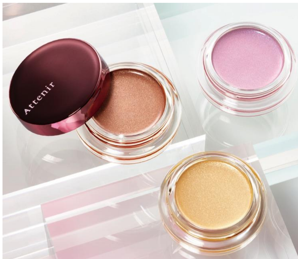
写真左から(ハニーブラウン・イエローゴールド・モーブピンク)

パールが陰影をつくるため、1色で上質な濡れ艶と自然な立体感を演出。目もと全方位、どこから見ても上品な輝きを放つ新感覚のジェル状アイカラーの登場です。うるおいのあるジェルがまぶたにしっかりピタッ！とフィットして、つけたての色が長時間続きます。さらに、メイクライン共通の「隠しピンク設計」*1により、大人のメイク悩み“くすみ”を取り払い、肌映えのする美しい仕上がりになります。