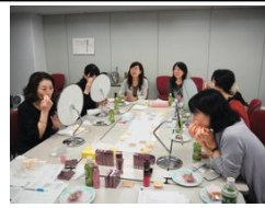
アテナア アンバサダーの皆様との会議の様