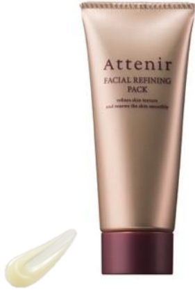
ハーバルアロマの香り

内容量 : 60g(約1ヵ月分) / 目安量: 500円玉大程度 使用感 : とろりとしたジェルが肌に密着。つるつるの洗いあがり。