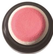
なめらかでしっとりしたクリームタイプ。