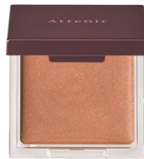
化粧直しに便利な鏡付き。ジェル状。