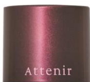
(パフ表面に1回分の中身がつくので、キャップを回して開けて使用。)

肌にツヤと血色感をプラスし、一気に表情の鮮度をアップさせる大人メイクの救世主アイテム。コンパクトサイズで狙ったところにポンポンと入れやすく、クリーム状だから肌に溶け込むように密着。内側から上気しているような、幸せあふれる印象をキープできます。