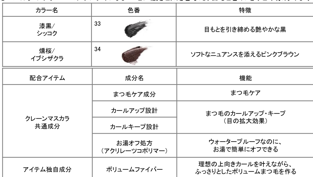
燻桜/イブシザクラ

無香料、無鉱物油、パラベンフリー、アレルギーテスト済み(すべての方にアレルギーが起きないわけではありません)