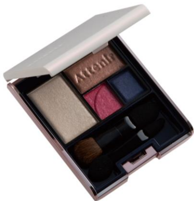
花明かり/ハナアカリ

目もとのエイジング印象が気になる大人のための4色組アイカラー。深い大人ピンクのリフトアップカラーが桜のようにほんのりと、春の「華やかさ」で彩りながら、目をパッチリと大きく見せます。