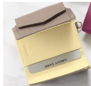
表面と中面でレザーの色が異なるバイカラーのデザイン

カラーは化粧品会社ならではの目利きでセレクトした大人の手もとを美しく彩る7色のラインナップ。表面と中面で色が異なる2色を組み合わせたバイカラーのデザインで、財布を手にした際にも、開けた際にも胸が高鳴るようなエレガントさです。