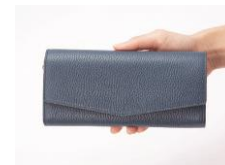
女性の手になじむ スマートなサイズ