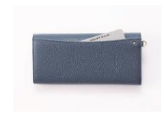
背面には便利な オープンポケット付き