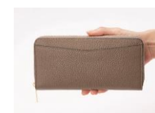
正面には便利な オープンポケット付き