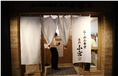
『らーめん食堂 あの小宮』大崎ガーデンタワー店

『らーめん食堂 あの小宮』大崎ガーデンタワー店とは、人気つけめん専門店「つけめん TETSU」の創業者である小宮 一哲氏がプロデュースした「あの小宮」シリーズの4店舗目です。「あの小宮」は2017年8月に都立大学に2店舗同時オープン後、同年10月には中国・上海の上海地下鉄徐家匯駅構内に海外進出も果たしています。