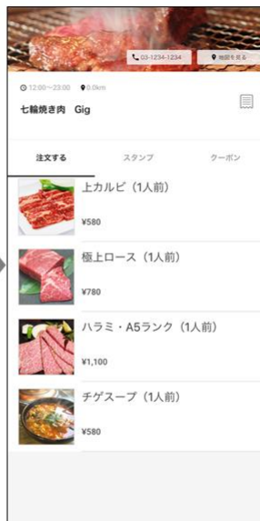
メニュー選択画面