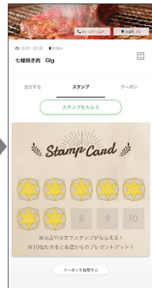
スタンプカード画面