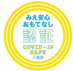
「みえ安心おもてなし認証」の認証マーク

「みえ安心おもてなし施設認証制度」におけるモバイルオーダー推奨について 「みえ安心おもてなし施設認証制度（あんしん みえリア）」は、三重県が新型コロナウイルスの感染対策として創設した飲食店向けの認証制度です。その中の推奨事項として、「デジタル技術を活用したオーダーシステム」の導入を取り入れており、スマートフォンなどから来店者自身で注文を行うモバイルオーダーシステムの導入により店員との接触や会話を軽減するよう促しています。