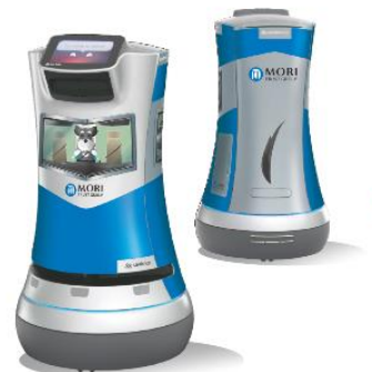
▲『Café & Deli GGCo.』Relay デザイン

※Relay (Savioke Inc. 販売: 株式会社マクニカ) との連携に当たっては、株式会社マクニカがエレベータシステム等の設備とのインテグレーションを担当。