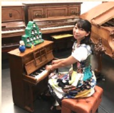
ふたりぼっち交響楽団 イマイキ