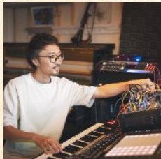
電子音楽家 ATSUSHI ASADA

様々なミニピアノでのソロやデュオ演奏のほか、公開レッスンやプロから学べる講座など、ミニピアノの魅力をたっぷり堪能できる11のプログラムに参加できます。