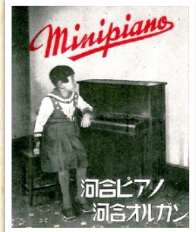
当時の販売カタログ (1930年頃)

ピアノが高価な当時、本物のピアノで子供達に音楽を学ばせたいという夢や希望から、ミニピアノが誕生しました。