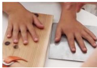
木と金属の温度の違いを体験