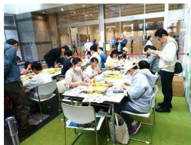
「WOOD DESIGN EXPERIENCE」仙台(2025年5月)開催の様子