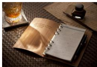
iLignos システム手帳 名古屋木材株式会社(愛知県)