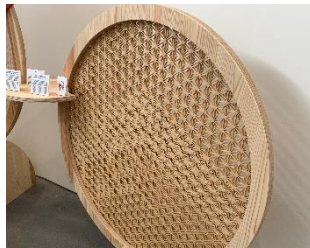
能登地震で被災した家屋から取り出し た木材を使った組子アート