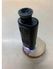
ルーペで木の構造を観察してみよう