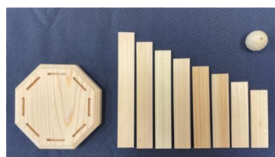
円形木琴のキットで自分だけの作品をつくらう