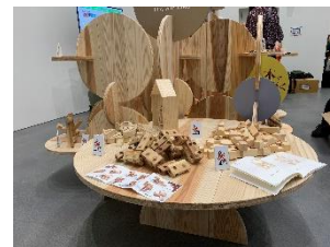
木製組み立てパズルや木製ブロック で自由に遊んでいたいただけます