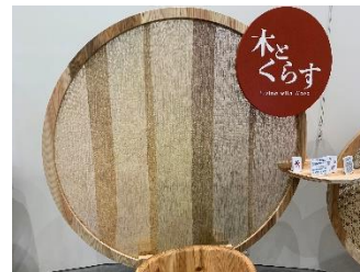
樹木からつくられた布を天然染めて 「日本の秋」を表現したアート