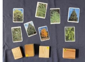
木の種類を当ててみよう