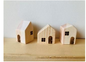
6つのプログラムを回ってスタンプを集めると「ヒノキの小さな木のおうち」をプレゼント