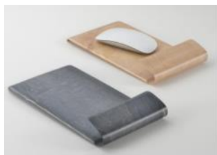
曲げ木パネのマウスパッド ストーリー株式会社(新潟県)