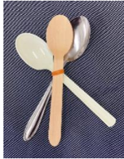
木、プラスチック、金属の違いを感じてみよう