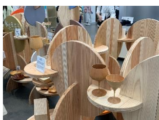
大阪・関西万博で展示され、 好評を博した木製ユニット