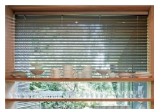
国産スギを活用した 「スギシリーズ ウッドブラインド」 ナニックジャパン株式会社(東京都) / 那須塩原市森林組合(栃木県)ほか

※出展内容は、運送状況等の諸事情等により変更となる場合がございます。予めご了承ください。