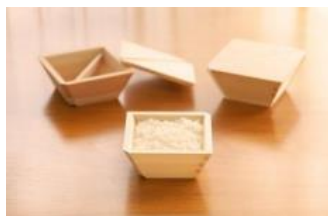
木製の冷凍ご飯容器「COBITSU」 有限会社大橋量器(岐阜県) / 南地秀哉(千葉県)