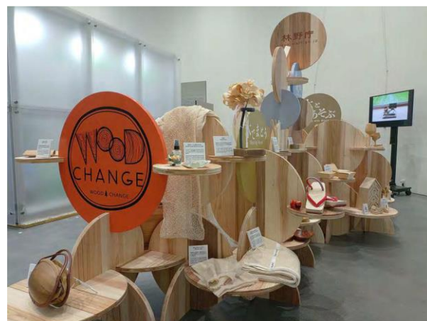
(左)WOOD DESIGN EXPERIENCE@仙台の様子 (右)関西万博でも使用された、今回の展示台

会場では木に親しむワークショップ、トークショーなど多彩なプログラムの他、「木のある暮らし/体験ゾーン」、「木を知る・学ぶゾーン」として、身近な木製品の数々を展示します。また、会場内に「木の体験ラリ屋台」を設け、木育ツアーも実施します。優れた木のデザインを顕彰するアワード「ウッドデザイン賞」の受賞作品を中心に、美しく、機能性に優れた家具や木製品、木質空間を体験ができ、幅広い年齢層が楽しめる内容となっています。日本の森林資源を活かした「伐って・使って・植えて・育てる」循環型社会の実現に向け、木材のある豊かな暮らしを体感できる貴重な機会です。ぜひご来場ください。