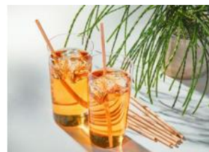
国産間伐材の木製ストロー AQUAS 株式会社アキュラホーム(東京都)