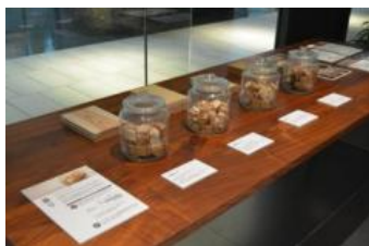
木の香りでリラックス体験

木の香りや手触りを体験できるコーナー、木製おもちゃで自由に遊べるコーナーを設置。木に直に触れ、その感触を楽しむことができます。