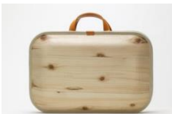
monacca 株式会社エコアス馬路村(高知県)