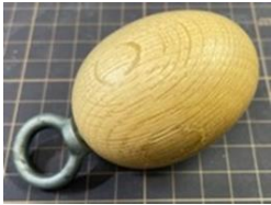
様々な木のおもちゃを触ってみよう

「ふしぎな木のおもちゃであそぼう」「木のスプーンはどれかな?さわってあてよう」「ルーペで木の様子をみてみよう」など、6つの木のふしぎ屋台を回って、木を触って、感じる木育ツアーを2日間にわたって開催します。6つの屋台すべてを回りスタンプを集めた方には、すてきな木のノベルティを差し上げます。