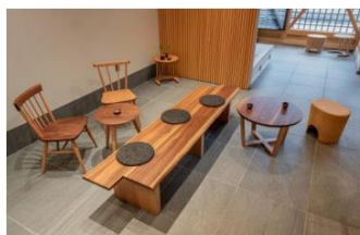
国産材家具 大杉シリーズ ナイス株式会社(神奈川県) / 柏木工株式会社(岐阜県)

ウッドデザイン賞を受賞した内装、雑貨・インテリアを多数展示。木製品に囲まれた暮らしの空間を体験できます。