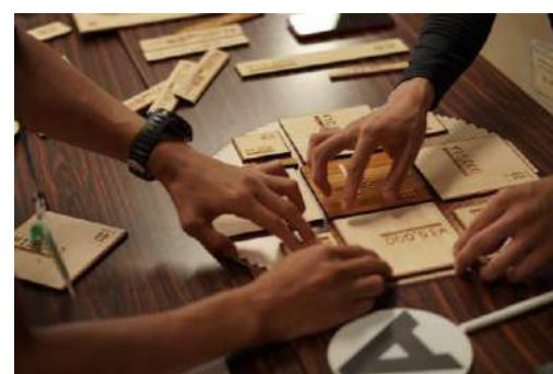
セーザイゲーム 熊野林星会 コミュニケーション分野

昨今のサウナブームにより各所に増えているサウナだが、一般的には羽目板の壁など空間が均一化しがちである。本作品は空間全体で木に包まれているような感覚になる優れた意匠性を持つ希少なサウナである。立地の良さと相まって、五感で感じるサウナ空間となっている点を高く評価した。