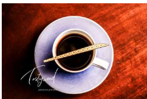
tastywood ～JAPANESE JUNIPER～ 有限会社一場木工所／株式会社レオンハルト／蒸留ラボ Laboratory Pnacea／込山 宏美／青水里山の会／アートの小箱 プロダクツ分野

木組みの格子の意匠が特徴的な新しいインテリアの提案である。室内を彩る細やかな細工があり、隠すという概念に着目した点に新規性がある。