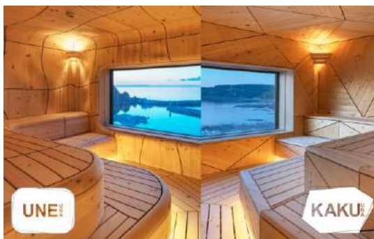
北こぶし知床ホテル&リゾート UNEUNA／KAKUUNA 株式会社アーティストリー／株式会社知床グランドホテル／TTNE株式会社／株式会社河面組 建築・空間分野

川沿いに点在する休憩場所やサインのデザインを統一し、エリア全体で木材に触れ、安らぐ時間を提供している点が良い。サイクリングの開放感と地域の自然、景観を堪能するにふさわしい体験装置としての環境デザインと言える。