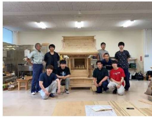
一間社流造本殿 伝統文化と環境福祉の専門学校 コミュニケーション分野

木造の木質バイオマス熱電併給施設で、地域との共生を体現する建築でありつつ、約3,600トンの間伐材利用と森林整備の促進など、地域の森林資源活用プロジェクトのシンボリックな存在になっている。