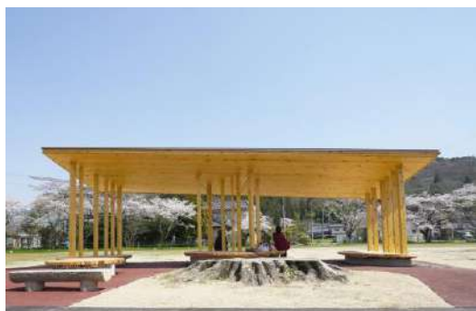
サイクリングロード “旭川・りんくるライン” 株式会社ofa／真庭市／株式会社タブチ／株式会社松岡建設／株式会社MID研究所／SASA ATORIE 建築・空間分野

川沿いに点在する休憩場所やサインのデザインを統一し、エリア全体で木材に触れ、安らぐ時間を提供している点が良い。サイクリングの開放感と地域の自然、景観を堪能するにふさわしい体験装置としての環境デザインと言える。