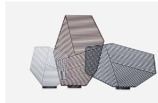
SHA/SHA 中井産業株式会社 プロダクツ分野

和の空間にもマッチする洗練されたデザインの椅子である。強さと軽さの両立、畳を始めとした床への負担を抑える工夫など随所に工夫が凝らされている。