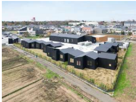
なないろこまち 株式会社黒田潤三アトリエ／医療法人社団清虹会／株式会社東武建設 建築・空間分野

凹型の敷地形状を活かし、エリアごとに木質構造の課題解決に向けた取組を採用した新規性ある建築である。木質感が溢れる外観、木造エリアのエントランスホールなど街に開かれた顔を持ちつつ、執務室や交流空間は、内装木質化が優しくワーカーや来訪者をもてなしている点も良い。