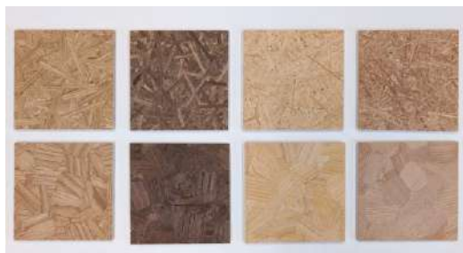
VARABOARD 株式会社山崎商事／株式会社エスウッド 技術・建材分野

突板の薄さを活かしながら、樹種ごとの特徴、質感を活かした化粧ボードであり、空間のテイストに合わせて様々な用途での活用が見込める製品。