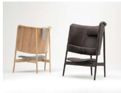
フラン リビング 株式会社カンディハウス プロダクツ分野

戸建て住宅が並ぶ「街」を想起させる、コミュニティ機能を持つクリニックである。既存の医療空間にありがちな無機質な空間ではなく、木材を多用し居心地のよい空間を実現しており、医療や育児、街の交流拠点として人をひきつける魅力がある。子どもを産み育てる地域の人々によるコミュニティでありたいという思いが伝わる建築である。