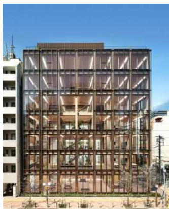
ジューテック本社ビル 鹿島建設／株式会社ジューテック／住友林業株式会社 建築・空間分野

凹型の敷地形状を活かし、エリアごとに木質構造の課題解決に向けた取組を採用した新規性ある建築である。木質感が溢れる外観、木造エリアのエントランスホールなど街に開かれた顔を持ちつつ、執務室や交流空間は、内装木質化が優しくワーカーや来訪者をもてなしている点も良い。