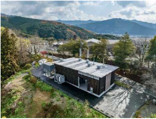
内子龍王バイオマス発電所 株式会社内子龍王バイオマスエネルギー／有限会社内藤鋼業／株式会社竹中工務店／株式会社サイプレス・スナダヤ／三洋貿易株式会社／大日本ダイヤコンサルタント株式会社 コミュニケーション分野

木造の木質バイオマス熱電併給施設で、地域との共生を体現する建築でありつつ、約3,600トンの間伐材利用と森林整備の促進など、地域の森林資源活用プロジェクトのシンボリックな存在になっている。