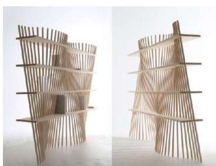
shell × shelf 株式会社阿部蔵／森庄銘木産業株式会社 プロダクツ分野

ネズミサシという森林資源の活用を目指したプロダクトであるが、マドラーとしてかき混ぜると味がまろやかになるユニークな作品。山への還元と五感への訴求を両立した。