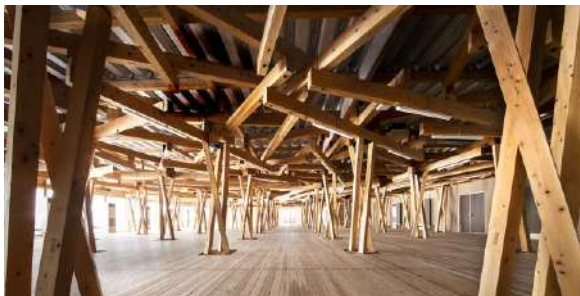
選手村ビレッジプラザ 株式会社日建設計 建築・空間分野

伝統的な建築を想起させる空間づくりが、各国から訪れる選手や関係者へ向けて日本の木の使い方や技、空間の味わいの素晴らしさを発信している。組立解体を前提とした設計、構造と細部に至る各地域の木材の使い方など、日本の木材文化のショールーム的な役割を担う素晴らしい取組である。