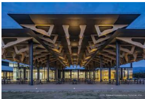
東海大学阿蘇くまもと臨空キャンパス食品加工教育実習棟 株式会社石本建築事務所／東海大学／三井住友建設株式会社／山佐木材株式会社 建築・空間分野

伝統的な建築を想起させる空間づくりが、各国から訪れる選手や関係者へ向けて日本の木の使い方や技、空間の味わいの素晴らしさを発信している。組立解体を前提とした設計、構造と細部に至る各地域の木材の使い方など、日本の木材文化のショールーム的な役割を担う素晴らしい取組である。