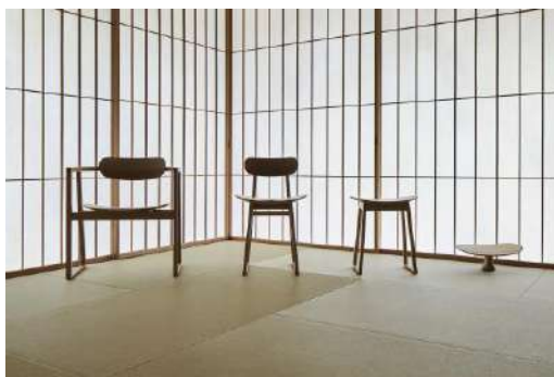
SUWARI 飛騨産業株式会社 プロダクツ分野

突板の薄さを活かしながら、樹種ごとの特徴、質感を活かした化粧ボードであり、空間のテイストに合わせて様々な用途での活用が見込める製品。