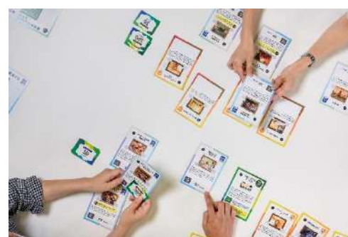
やまなしSDGsプロジェクト 「moritomirai (モリトミライ)」 山梨日日新聞社 コミュニケーション分野

くり抜いたCLTの意匠が建築全体にインパクトを与えており、CLTという建材を主役に見立てた独創的な取組である。芝生広場や半屋外空間は開放的で心地よい居場所となっている。普段、あまり建材を意識することのない来訪者や利用者にもCLTの可能性をアピールできる点が良い。