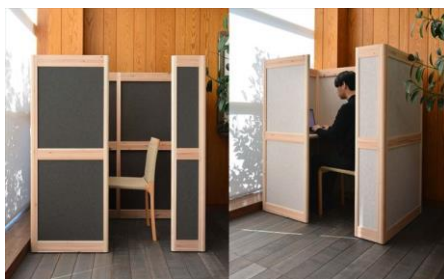
Grove 株式会社ワイス・ワイス（東京都） 株式会社マルホン（静岡県） 木製品分野

木材を使用したエシカル製品の開発に寄与する独創性の高い技術提案であり、その質感が驚くほど革に近い。皮革製品と比較した場合の木材由来の特性も雑貨や日用品での活用の幅を広げるだろう。