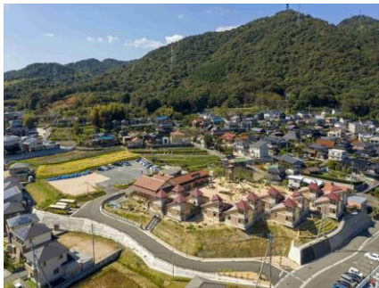
小郡幼稚園 無有建築工房 (大阪府) 学校法人片山学園 (山口県) 株式会社安成工務店 (山口県) 岡崎木材工業株式会社 (山口県) 建築・空間分野

築45年超の建物をリノベーションし、テーブル天板や個室ブース等に意図的に木材を多様し、ワークスペースの快適性や生産性向上と木材の関係性についての気づきをもたらす。未利用材を積極利用した内装や装飾も質が高い。