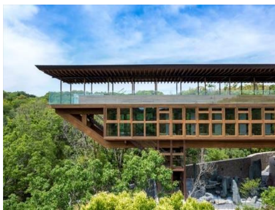
禅坊 靖寧 株式会社坂茂建築設計（東京都）株式 会社パソナグループ（東京都）前田建 設工業株式会社（東京都）ナイス株式 会社（神奈川県） 建築・空間分野

木造の構造躯体を外からでも見える構造とすることで、都市や来訪者に向けて木造建築物のインパクトを訴求して木の時代の到来を発信する役割を担うとともに、利用者のウェルビーイングをもたらす空間提案や効果分析などを行なった先端的な取組である。空間の用途ごとに五感や感性を刺激する樹種やデザインの工夫が施されているため、今後の展開にも期待が持てる。