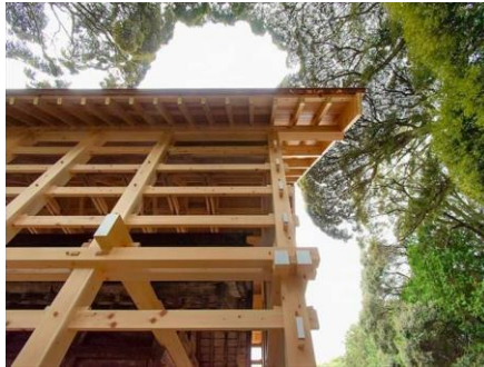
星野神社 覆殿新築及び本殿改修・復元 株式会社 望月工務店/望月建築設計室 (愛知県) 建築・空間分野

地域住民とともに参加型のプログラムを採用しながら、木造化を実現したアプローチは自分事化の好例である。郵便局という地域密着かつ店舗数の多い社会インフラがこうした取組を推進する意味は大きい。