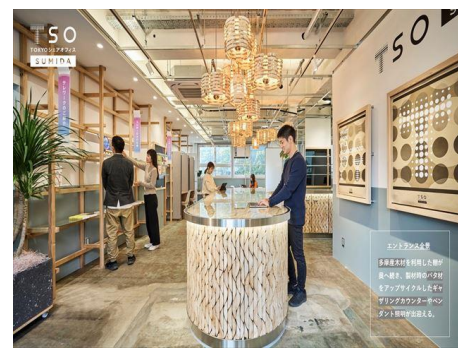
TOKYOシェアオフィス墨田 株式会社 船場 (東京都) 凸版印刷株式会社 (東京都) 株式会社 SALT (福岡県) 株式会社森未来 (東京都) 建築・空間分野

SRC構造体に木造建築物を入れ子状に組み込んだ独自性ある作品である。実質的に低層木造建築と見なされるため、木造住宅のノウハウや特徴を活かしてフロアごとに様々な空間デザインを見せることに成功している。