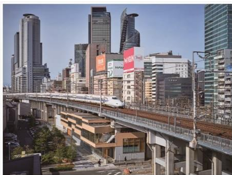
笹島高架下オフィス 名古屋ステーション開発株式会社（愛知県） 有限会社マル・アーキテクチャ（東京都） 帝人株式会社（大阪府） シーエヌ建設株式会社（愛知県） 坂田涼太郎構造設計事務所（東京都） 建築・空間分野

高架下という制約のある空間に快適に働くことができ、集いなくなる木造オフィスの提案に取り組んだ社会提案性のある作品である。駅近という立地は、街に開く木造建築のシンボリックな存在にもなる。