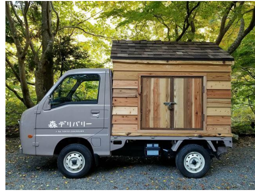
森への入り口をお届けします ～森デリバリー～ 株式会社東京チェーンソーズ（東京都） コミュニケーション分野

大径木の利用に向けて、製材、建築、施主が連携して取り組むことで課題解決と地域の様々な価値創出につながった意欲的な作品である。大径木は大きなまま使うことで歩留まりを向上させ山側の利益につなげるとともに、仮に解体された後でも再利用できるなど、経済性、社会性とダイナミックな空間づくりを同時に満たしている。