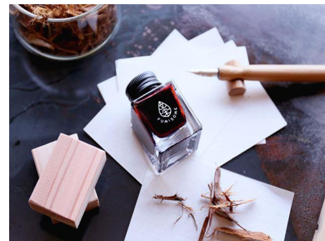
ひみり山杉からできたインク/つけペンセット 岸田木材株式会社（富山県） 株式会社竹田事務機（京都府） 株式会社田中直染料店（京都府） 株式会社岸田（富山県） 木製品分野

アトリウムを象徴する木格子パネルはカフェラウンジやステージを明るくして、交流や活動を促す場づくりにつながった。意匠性を重視した木の使い方はインターナショナルスクールに日本らしさを表現することに成功している。