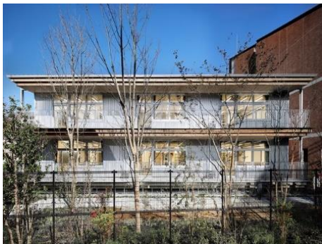
昭和学院小学校ウエスト館 株式会社 日建設計 | Nikken Wood Lab (東京都) 学校法人昭和学院 (千葉県) 建築・空間分野

軒の高さを抑えつつ、国産杉CLTを構造と内装材として使いながら、交流を生む空間づくりに配慮した。生徒がその表情や質感を感じられる設計の工夫があり、ダイナミックかつ洗練された学びの空間を実現させている。