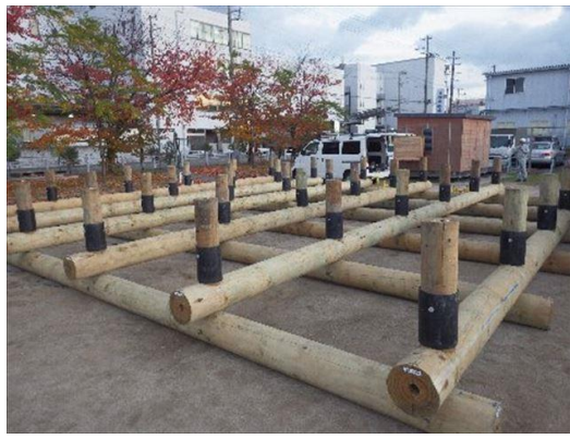
木製浮き基礎工法 越井木材工業株式会社（大阪府） 技術・建材分野

雄大な木造ドームや木質感の溢れる回遊型の大空間で、子どもの年齢、性別問わず思いのままに遊べ、多様でチャレンジな遊びを誘発する。雨天の際や冬季の外遊びの制限といった課題を解決するための屋内型施設は地域にとって貴重であり、その外観も周辺風景に溶け込む美しさを併せ持っている。