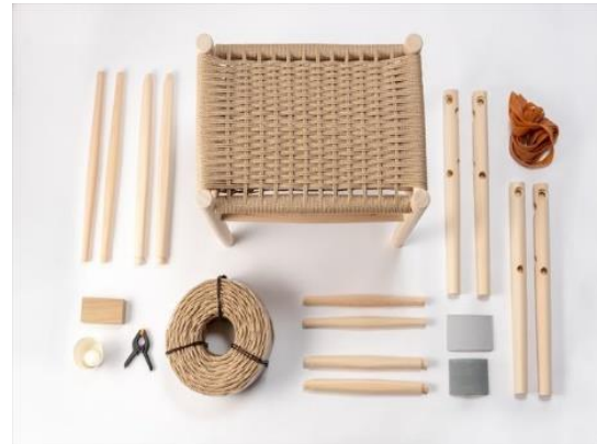
Do kit yourself 家具キット 株式会社維鶴木工（奈良県） 木製品分野

基礎部分は、建築物が完成した後では意識されることは少ないが、こうした分野にも木材を積極的に活用し、解体・廃棄・再利用までを含めたライフサイクルコストにおける優位性と環境配慮を施主や事業者が意識を向ける契機となる点は高く評価できる。防腐処理を施した解体部材は再利用も容易で、杭や擁壁などの土木分野での再利用も可能である点も有用性が高い。