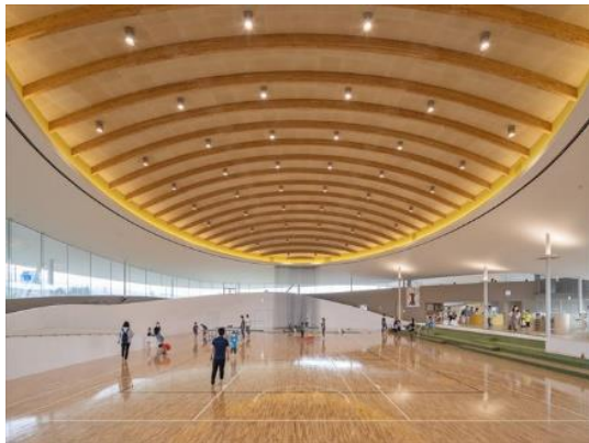
シェルターインクルーシブプレイスペース コパル（山形市南部児童遊戯施設） 山形市（山形県）大西麻貴＋百田有希／o+h （東京都）株式会社シェルター（山形県）株 式会社高木（山形県）合同会社ヴォーチェ （山形県）特定非営利活動法人 生涯スポーツ 振興会（アプルス）（山形県） 建築・空間分野

雄大な木造ドームや木質感の溢れる回遊型の大空間で、子どもの年齢、性別問わず思いのままに遊べ、多様でチャレンジな遊びを誘発する。雨天の際や冬季の外遊びの制限といった課題を解決するための屋内型施設は地域にとって貴重であり、その外観も周辺風景に溶け込む美しさを併せ持っている。