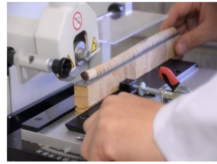
木材の未来を拓くゲノム診断技術 住友林業株式会社 (茨城県) 北海道立総合研究機構 森林研究本部 林業試験場 (北海道) 北海道立総合研究機構 森林研究本部 林産試験場 (北海道) 調査・研究分野

伝統技術の継承と地域材利用による環境保全、伝統や文化を伝達の三位一体の取組として、百年単位での視野に感銘を受けた。学生や若手大工の育成にもつながる社会的にも重要な取組である。