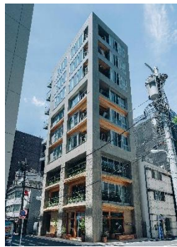
KITOKI 平和不動産株式会社 (東京都) 株式会社 A D X (福島県) 建築・空間分野

軒の高さを抑えつつ、国産杉CLTを構造と内装材として使いながら、交流を生む空間づくりに配慮した。生徒がその表情や質感を感じられる設計の工夫があり、ダイナミックかつ洗練された学びの空間を実現させている。