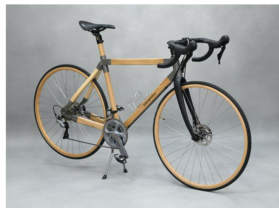
木製自転車スポーツタイプ TR-S型 E-Thruタイプ カネモク工業株式会社（東京都） 木製品分野

自然の中に身をゆだね、天空で木に囲まれながら心身の健康やウェルビーイングを実感できる感性に訴える非常に美しく、豊かな空間である。古来から座禅の空間は木が使われ親しまれてきたが、新たな解釈と技術、デザインでその価値を見事に再発見させる建築である。豊富なプログラムや宿泊機能など、多様な参加者ニーズに応えている。