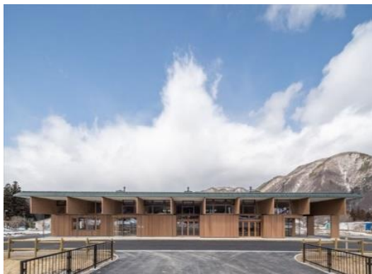
みなみあいづ森と木の情報・活動ステーション「きとね」 南会津町（福島県） 建築・空間分野

縦ログと重ね梁を用いた、木に関わる様々な活動や情報の拠点となる施設であり、木産地である同町のサプライチェーン構築に取り組んだロールモデルとして評価できる。空間は機能別にうまくまとまっており、フローリングや家具には樹種名の説明を設けるなど来訪者に対する木育機能も持っている。