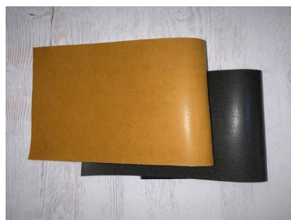
Wood Leather サンプロ株式会社（京都府） 木製品分野

製材過程で生まれる杉皮を煮沸してインクを製造、木製ペンとのセットで販売したユニークな作品で、書き味もよい。書くという行為を通じ、暮らしの中でごく普通に木の付加価値利用をもたらしてくれる。