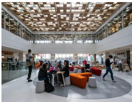
Canadian Academy 株式会社竹中工務店（大阪府） 学校法人カネディアン・アカデミー（兵庫県） Karen Glandrup Architects（兵庫県） 株式会社小林木工（兵庫県） 建築・空間分野

高架下という制約のある空間に快適に働くことができ、集いなくなる木造オフィスの提案に取り組んだ社会提案性のある作品である。駅近という立地は、街に開く木造建築のシンボリックな存在にもなる。