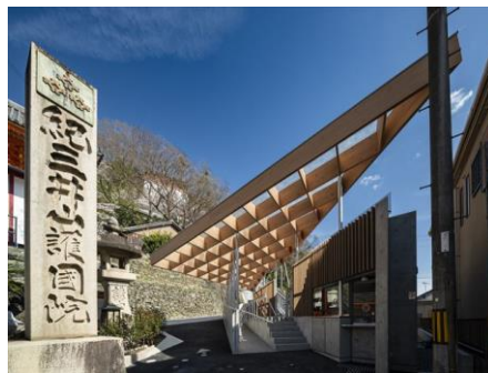
紀三井寺ケーブル山麓駅 清水建設株式会社 (東京都) 紀三井寺 (和歌山県) 建築・空間分野

小さな木の家が並ぶように構成された、周辺環境と融合した穏やかな建築が素晴らしい。地域の技術で建てられた園舎は、園庭の活用や農との接点を重視した活動などの取組とともに親和性がある。