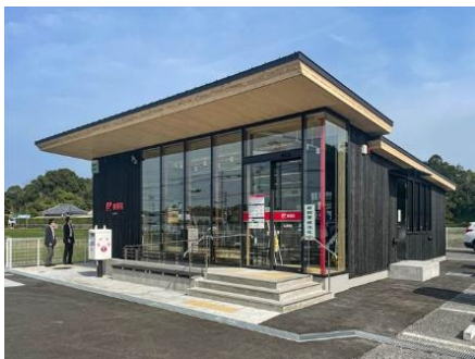
みんなで作るみんなの郵便局「丸山郵便局」 日本郵政株式会社一級建築士事務所 (東京都) 日本郵便株式会社 (東京都) 住友林業株式会社 (東京都) 南房総市教育委員会 (千葉県) 株式会社早川 (千葉県) 建築・空間分野

地域住民とともに参加型のプログラムを採用しながら、木造化を実現したアプローチは自分事化の好例である。郵便局という地域密着かつ店舗数の多い社会インフラがこうした取組を推進する意味は大きい。