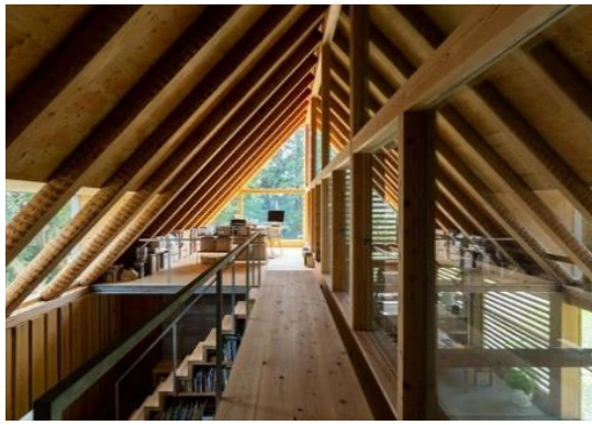
baumasterの家 株式会社平成建設（静岡県） 網野禎昭（静岡県） 株式会社宮田構造設計事務所（東京都） 二宮木材株式会社（栃木県） 株式会社長谷川萬治商店（東京都） 建築・空間分野

縦ログと重ね梁を用いた、木に関わる様々な活動や情報の拠点となる施設であり、木産地である同町のサプライチェーン構築に取り組んだロールモデルとして評価できる。空間は機能別にうまくまとまっており、フローリングや家具には樹種名の説明を設けるなど来訪者に対する木育機能も持っている。