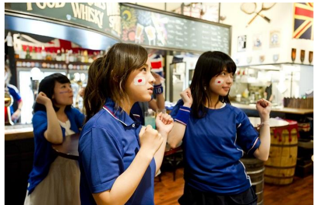
スポーツバー「THE FooTNIk Nakano - British Pub」でのサッカー観戦の様子