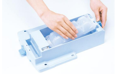
製氷皿も取り外しが簡単 ※製氷ユニットは水洗いできません。