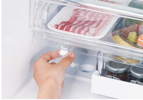
給水パイプがとても短い

「飲みもの入れる氷はいつも清潔に保ちたい」というニーズにお応えし、当社独自の設計により、給水タンクからパイプ・製氷皿まで、水の通るところはすべて取りはずして洗うことができます。また、内蔵の赤外線センサーが氷の表面温度を感知し、製氷時までの時間ロスを短縮します※5。