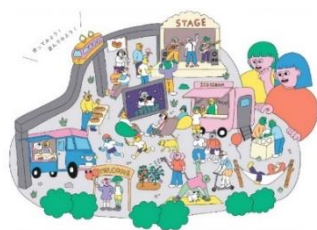
高架下でPLAYしよう! イベントアイデア募集! 高架下 イベントアイデア募集広告

2023年3月11日に開催した第4回『PLAY!高架下』の会場において、1次審査で選んだ3作品の来場者投票を行い、今回 glamconnect+(グランコネクト プラス) さんによる、「クリーニングデイ@Under the 恐竜」を開催することといたしました。