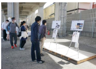
来場者投票の様子