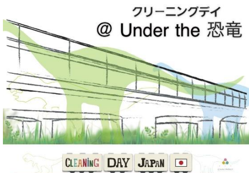
イベントテーマのイメージ（作成『glamconnect+』）

【『glamconnect+』のInstagram】 https://www.instagram.com/glamconnect_plus/