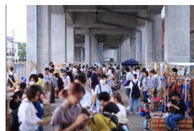
2023 年 7 月 8 日イベントの様子

(公式 Instagram は こちら ) ※掲載情報は変更となる場合があります。あらかじめご了承ください。 ※雨天決行・荒天中止とさせていただきます。