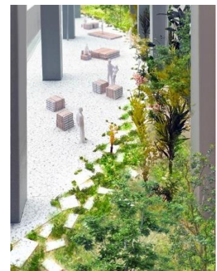
広場空間 模型写真

広場としての日常空間と、マルシェイベント等の非日常空間をフレキシブルにモードチェンジすることが可能になります。多種多様な地域活動を受け入れるフィールドとなることを目指します。