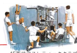
4F西武アスレティッククラブ