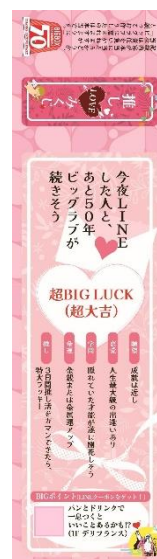
推しみくじ（イメージ）