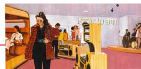
9F音の広場(ミュージックプラザ)