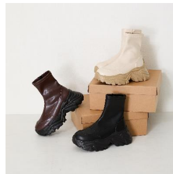
スニーカーソールショートブーツ