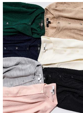
メリノウールネック カーディガン