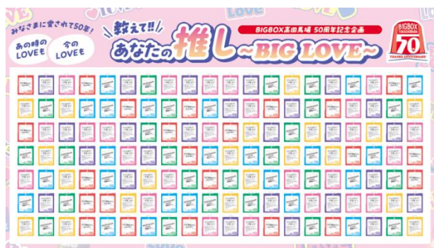
推しカード 特設ボード（イメージ）