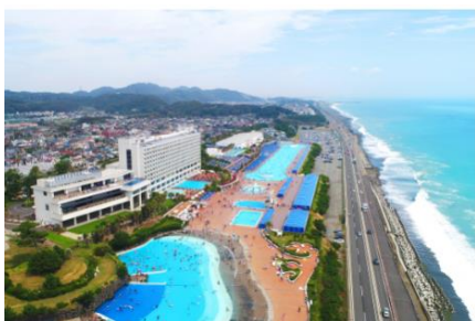
大磯ロングビーチ

大磯ロングビーチ、鬼押出し園、志賀高原焼額山スキー場、北の峰ゴンドラ（富良野スキー場）、富良野ロープウェー（富良野スキー場）、箱根園、軽井沢 72 ゴルフ練習場、軽井沢千ヶ滝温泉、有栖川清水など