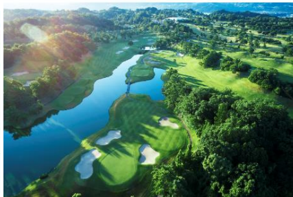
瀬田ゴルフコース