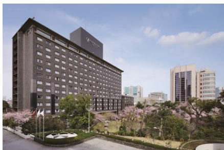
グランドプリンスホテル高輪

東京プリンスホテル、グランドプリンスホテル高輪、品川プリンスホテル、富良野プリンスホテル、新富良野プリンスホテル、十和田プリンスホテル、孺恋プリンスホテル、軽井沢プリンスホテル、軽井沢浅間プリンスホテル、志賀高原プリンスホテル、新横浜プリンスホテル、ザ・プリンス箱根芦ノ湖、箱根仙石原プリンスホテル、箱根湯の花プリンスホテル、大磯プリンスホテル、鎌倉プリンスホテル、川奈ホテル、プリンス スマート イン 熱海、伊豆長岡温泉 三養荘、びわ湖大津プリンスホテル、日南海岸 南郷プリンスホテル