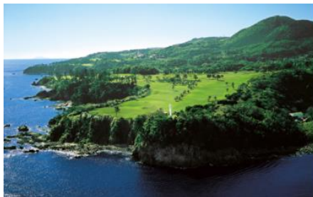
川奈ホテルゴルフコース