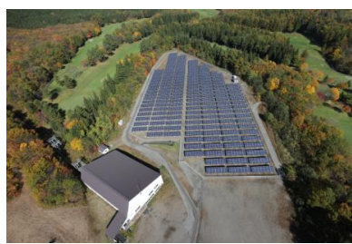
プリンスエナジーエコファーム雫石