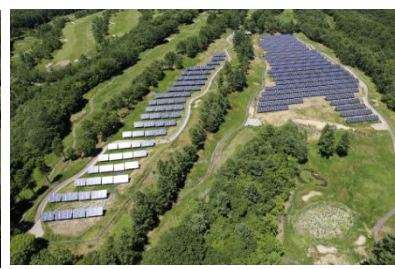
プリンスエナジーエコファーム嬬恋