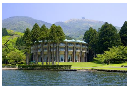
ザ・プリンス箱根芦ノ湖