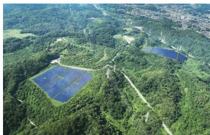
西武武山ソーラーパワーステーション