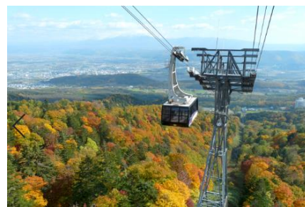
富良野ロープウェー