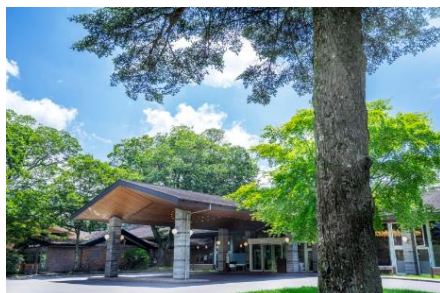
軽井沢プリンスホテル