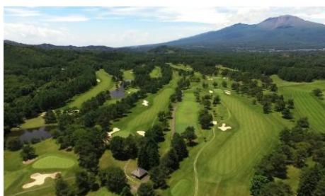
軽井沢 72 ゴルフ北コース

軽井沢浅間ゴルフコース、軽井沢 72 ゴルフ西コース、軽井沢 72 ゴルフ東コース、軽井沢 72 ゴルフ南コース、軽井沢 72 ゴルフ北コース、大箱根カントリークラブ、川奈ホテルゴルフコース、久邇カントリークラブ、新武蔵丘ゴルフコース、武蔵丘ゴルフコース、西熱海ゴルフコース、瀬田ゴルフコース