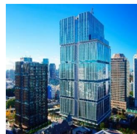
東京ガーデンテラス紀尾井町