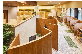
エミフィス大泉学園

西武グループおよび当社では、「多様な働き方」や「育児・介護と仕事の両立」など、従業員のワーク・ライフ・バランスを図る取り組みを推進しております。今後も当社では、従業員がさらに心身ともに健康で働きやすい職場となるよう環境整備に努めてまいります。