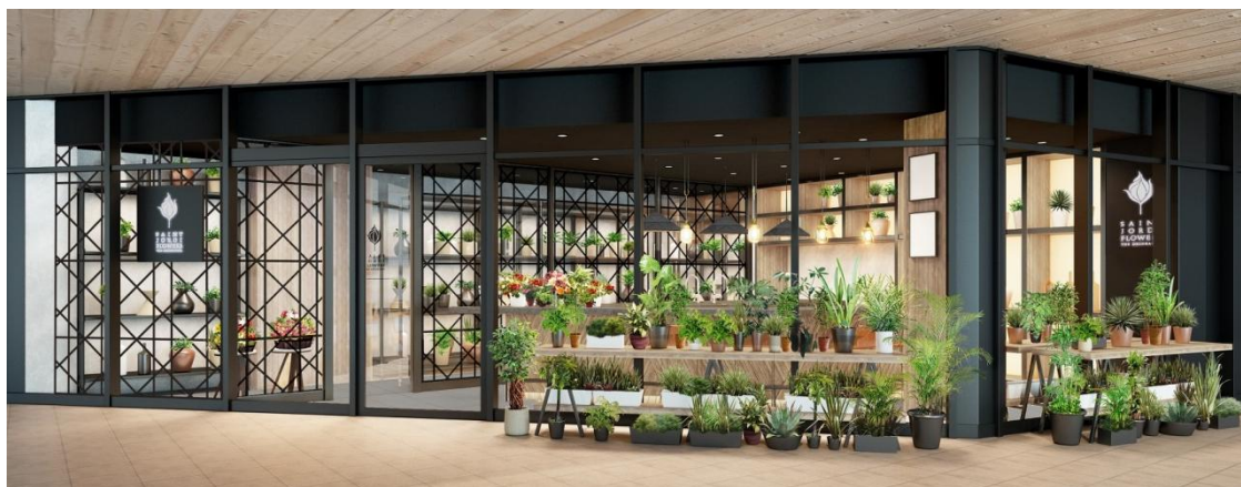
※パースはイメージ