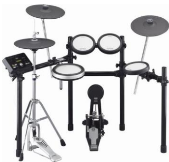
ヤマハ電子ドラム「DTX562KFS」