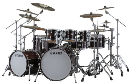
ヤマハ アコースティックドラム「Absolute Hybrid Maple」

https://jp.yamaha.com/products/musical_instruments/drums/ac_drums/drum_sets/absolute_hybrid_maple/index.html