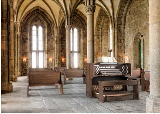
パイカント クラシックオルガン 『Majesty 450』