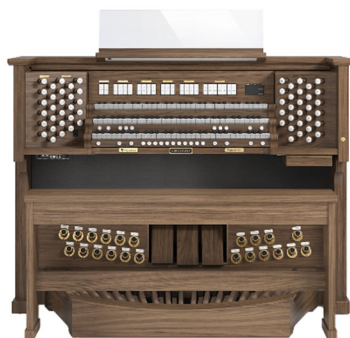
バイカウント クラシックオルガン『Majesty 450』