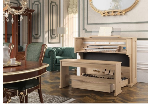
パイカント クラシックオルガン 『Majesty 200』